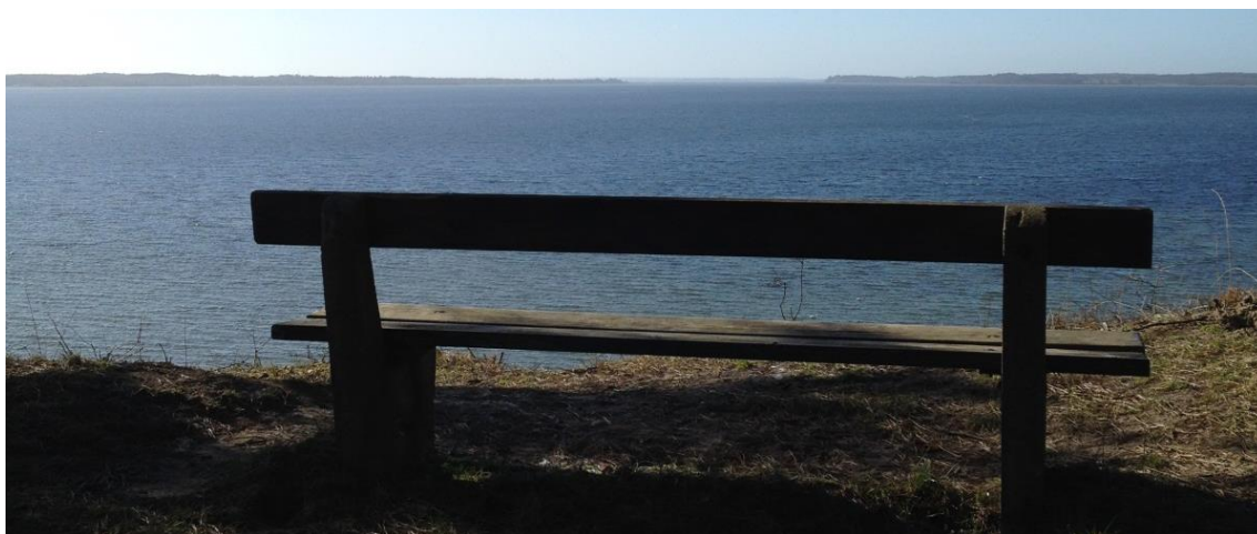
Foto 2: Udsigt mod fjorden hvor man kan se til både Hundested og Rørvig.

Kregme Strand omfatter en del af kystskræntlinjen i Halsnæs kommune, der også kaldes "Hvide Klint". Dette skyldes skrænterne, der i tidligere tider fremstod blottet og helt lyse. Kystskrænterne er meget markante, på en klar dag kan man se dem helt fra Lynæs. Det er også en særlig oplevelse når udsigten åbner sig op for en fra man begiver sig ind i området fra Parkovsvej til man står på toppen af skrænten og kigger næsten lodret ned på stranden.