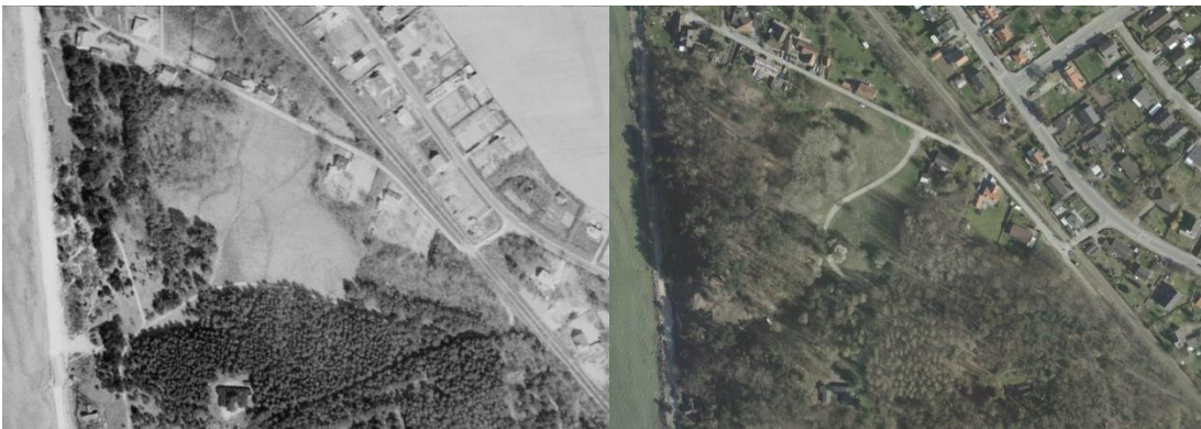
Foto 4: Kregme Strand som det fremstod i 1954 og i 2014. Især områderne langs kystskrænten og lergravene er siden da groet til.

En fredning som den pågældende for Kregme Strand, er en såkaldt "status quo" fredning. Det betyder, at målet for en naturpleje vil være den tilstand der var ved indgåelse af fredningen samt de bestemmelser der er beskrevet i fredningen, såfremt de foreskriver en ændring i tilstanden.