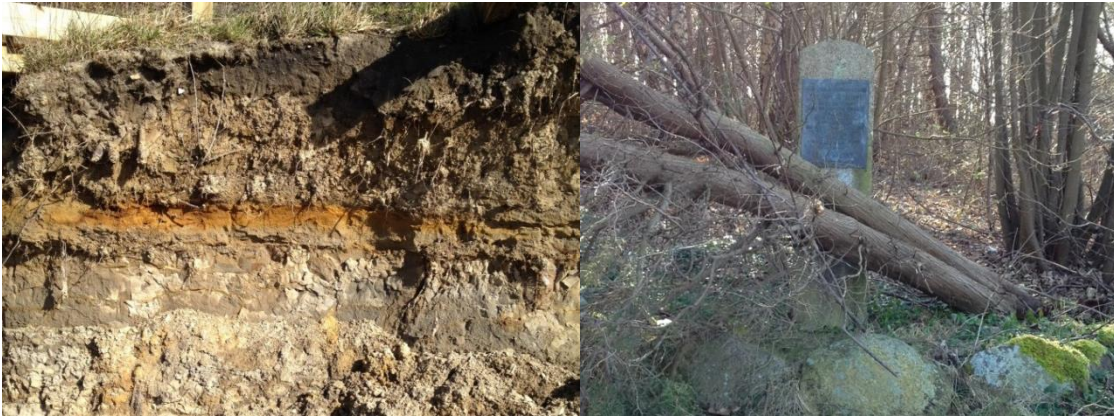
Foto 3: Historien er flere steder tydelig – både den geologiske og den kulturhistoriske.

Kregme Strand ligger tæt på skole, station, institution og er utroligt bynært. Det er derfor nærtliggende at udvikle arealets rekreative værdier, da det kan være til glæde for en stor og varieret befolkningsgruppe.