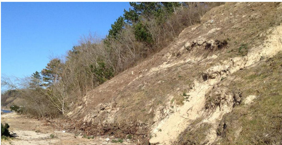
Foto 5: Det er tydeligt at se hvortil kystskrænten er blevet ryddet.

Stier og det åbne område slås hvert år. Et større område ved Bakketoppen er blevet ryddet og tyndet for at forbedre udsigt og forhold for flora. I samme ombæring blev et lille stykke af kystskrænten ryddet.